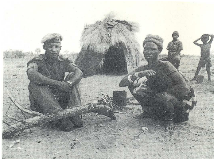
Ein Corporal der Buschmann-Einheiten mit seiner Ehefrau in Ruhestellung. Sein Abzeichen an der Kopfbedeckung ist ein Rhino und symbolisiert SWATF (Einsatzkommando nördlich der roten Linie). Die Aufnahme entstand nahe Tsumkwe im heutigen Namibia Gebiet.