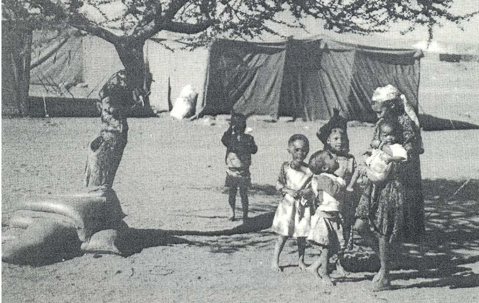
Trostlose Endstation: Notaufnahmeflager Smidtsdrift nahe Kimberley für die Buschmann-Soldaten und ihre Familien nach der Ausmusterung und dem Friedensschluss mit Angola. Nun fühlte sich niemand mehr verantwortlich für das weitere Schicksal dieser Menschen im neuen (schwarzen) Südafrika ...

Widerstand in Nachbarschaftsvereinen der Buren-Farmer mit heftigen rassistischen Reaktionen: Sie wollten keine "Wilden im Hinterhof" dulden und fühlten sich "irgendwie bedroht und im Stich gelassen ..."