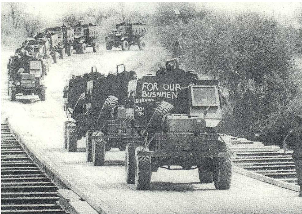
Rückkehr der Buschmann-Truppen nach Südwestafrika: Bataillon 201 überquert eine Brücke am Okavango Fluss in minensicheren "Buffels". Die weiße Schrift FOR OUR BUSHMEN ist als Ehrung gedacht (durch die Vorgesetzten bzw. Südafrikaner).