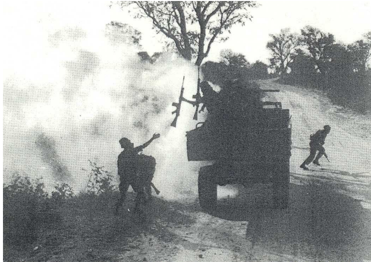
Die südafrikanischen Truppen stießen weit nach Angola vor, unterstützt von den fährtenkundigen Buschmännern in Uniform, ebenfalls militärisch ausgerüstet. Ihre Frauen und Kinder lebten in Camps der Caprivi Region unter dem Schutz der South African Defence Forces (SADF) bis zum Waffenstillstand.

schwierigem Gelände. Auf diese Weise entstand das Zelt Dorf Alpha, getrennt mit gehörigem Abstand für Buschleute und Schwarze aus Gebieten diesseits und jenseits vieler Grenzlinien. Die erwähnten 40 schwarzen Soldaten aus Angola enttäuschten rasch: sie gerieten in Streit mit dem Camp der Buschleute und wollten dort Frauen belästigen oder gar vergewaltigen. Linford sorgte energisch für straffe Ordnung.